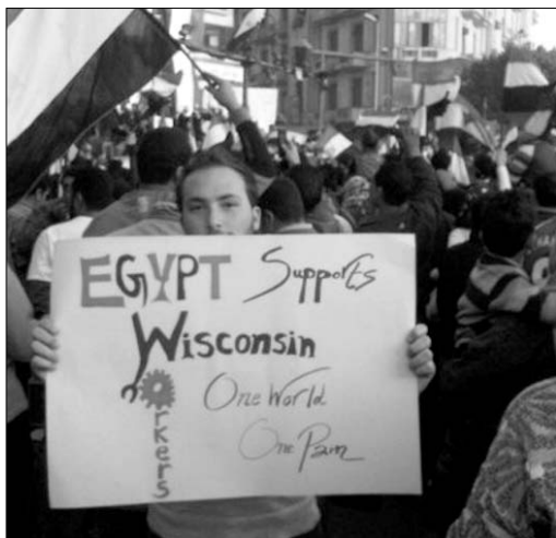
Solidaridad en Egipto con los trabajadores de Wisconsin

Wisconsin se ha convertido en un faro y en un modelo para el conjunto de la clase obrera norteamericana, representa un punto de inflexión en la lucha de clases en EEUU y también para el resto del mundo, y, por supuesto, es un ejemplo de los acontecimientos que están por venir. Se acaba de despertar un gigante que hasta ahora estaba dormido. Es difícil calcular con exactitud el tiempo y los ritmos, pero lo que sí es seguro que la lucha de clases en EEUU de nuevo está en el orden del día.