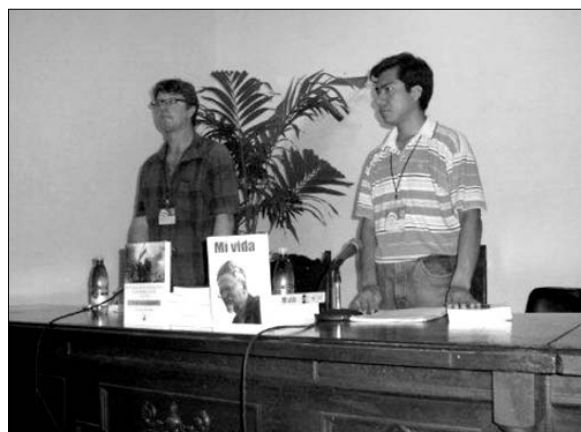
Arriba: stand de la Fundación; debajo: presentación de Mi vida

que el gobierno capitaneado por Raúl Castro está implementando y sus efectos para el futuro de la revolución cubana.