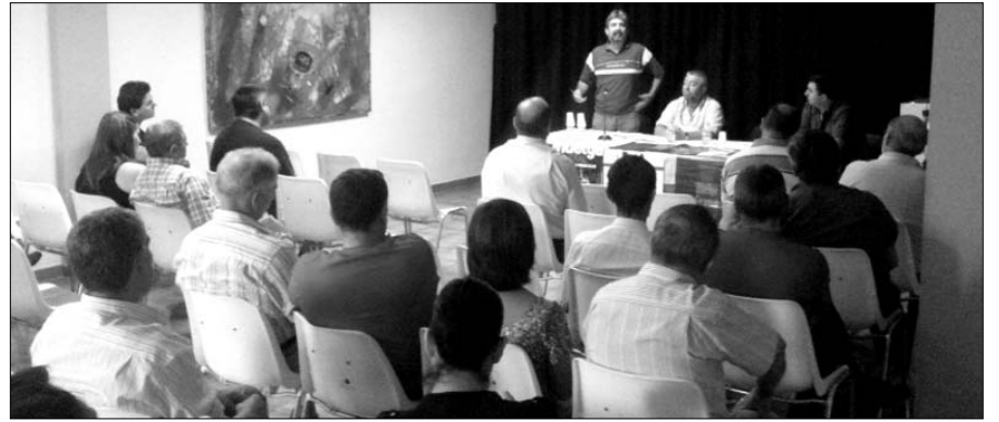
Reunión del Comité de Parados previa a la huelga general del 29-S

Después de tres meses de lucha, realizando recogida de firmas, asambleas, megafonía, carteles, pancartas, manifestación, rifa para apoyar la lucha, etc., fruto de todos los vecinos que apoyan esta movilización, el gobierno municipal tuvo que acceder a la vuelta del verano a una de las reivindicaciones de la asociación de parados de Álora, la creación de una bolsa de trabajo. Saludamos esta decisión positivamente, pero sinceramente pensamos que es insuficiente. Estamos convencidos de que la corporación municipal puede hacer más para enfrentar la crisis económica que padecemos los tra-