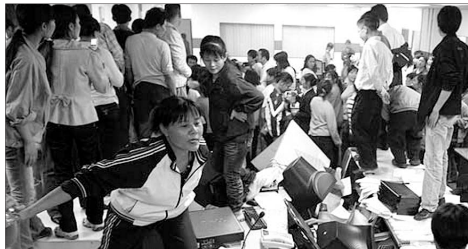
Trabajadores de la juguetera Kaida ocupan las oficinas de la empresa