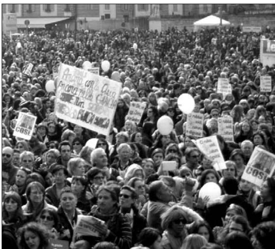
Una de las manifestaciones del pasado 13 de febrero en Italia

El pasado 13 de febrero, millones de personas se manifestaron en 60 ciudades de Italia exigiendo dignidad y respeto, pidiendo la dimisión de Berlusconi tras los escándalos sexuales y de prostitución de menores que han salido a la luz. En Roma más de un millón de mujeres, pero también muchos hombres llenaron la Plaza del Popolo mientras gritaban "Fuera Berlusconi" e "Italia no es un prostíbulo". Tras miles de escándalos políticos, las mujeres han saltado a la calle para expresar la rabia, la indignación ante los ataques y las humillaciones de la derecha sacudiendo profundamente a la opinión pública. Como decía Shukri Said, secretaria de la asociación Migrare: "Vivimos en un país de rodillas, con una clase dirigente podrida, hecha de fantoches sin credibilidad (...) Estos hombres intentan decirnos ahora que corromper a los menores con dinero es sólo un hecho privado. Que presionar a la policía para soltar a una menor es lo normal y que le atacamos porque somos puritanos. Eso sí es relativismo y no el que preocupa al Papa".