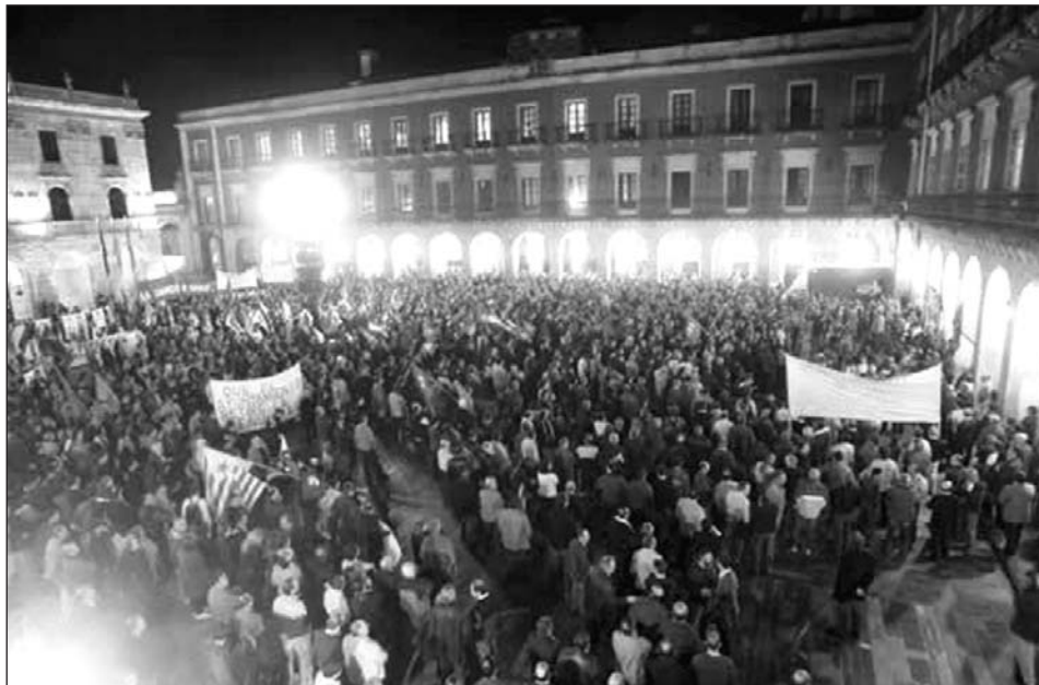
22 de noviembre de 2006: Manifestación histórica en Gijón contra la represión y por las libertades.

El resultado de esta situación de precariedad generalizada se refleja crudamente cuando miramos las estadísticas de accidentes laborales. En el primer semestre del 2007 (con respecto al mismo período en 2006) aumentaron en 1.000 los accidentes con baja dentro del centro de trabajo, llegando a los 10.595 y, sumando los accidentes sin baja, un total de 21.010. En ese período se produjeron 10 accidentes mortales, es decir que murió un trabajador cada 18 días.