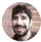
Alex García Izquierda Revolucionaria Madrid

Desde principios de noviembre las masas han puesto en jaque al Gobierno reaccionario de Piñera impugnando con su movilización el sistema capitalista chileno. No solo se han producido las manifestaciones más masivas de la historia, y hasta seis huelgas generales impuestas por el movimiento a la dirección de la CUT, la juventud se ha levantado librando una batalla heroica en las calles. Chile continúa en rebelión pero la burguesía, con la escandalosa colaboración de las direcciones reformistas del Partido Socialista (PS) y el Partido Comunista (PCCh), está maniobrando a fondo para descarrilarla.