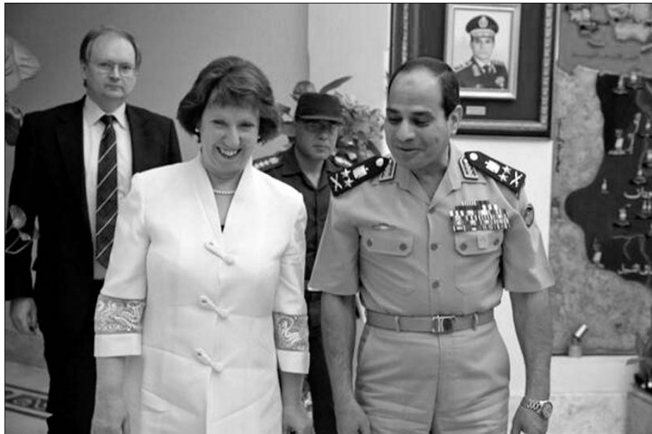
Catherine Ashton, representante de la UE para Asuntos Exteriores y Abdulfatah Al Sisi, al que ha visitado en cuatro ocasiones desde el golpe de Estado de hace diez meses

Las dificultades del régimen para aparentar apoyo popular se pusieron de manifiesto en la campaña electoral. El mitin central, en principio previsto en el Estadio Internacional de El Cairo, con capacidad para veinte mil personas, fue trasladado a una explanada, a donde apenas cuatro mil acu-