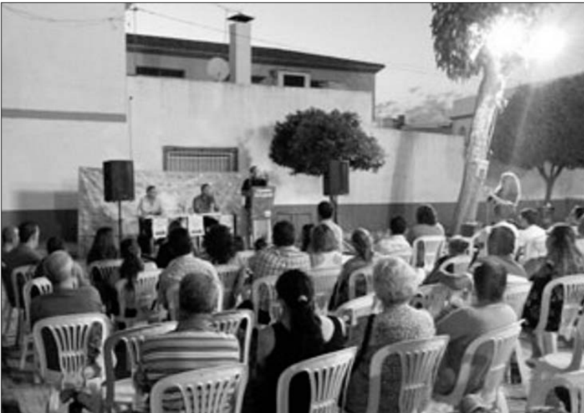
Mitin de Izquierda Unida de Villaverde del Río el pasado 16 de mayo