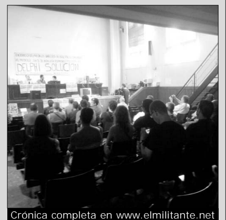
Crónica completa en www.elmilitante.net

En el debate intervinieron compañeros de CCOO en SDS explicando la victoria obtenida frenando el ERE encubierto tras una huelga indefinida; un veterano militante de la UGT, secretario general de Cádiz en la Transición; trabajadores de las gasolineras de Repsol en lucha contra nuevos despidos y ex trabajadores de Delphi.