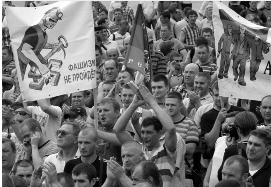
Manifestación de mineros en Donetsk

Las agresiones son especialmente violentas contra los activistas de izquierdas, y los militantes y dirigentes del Partido Comunista de Ucrania (PCU). Muchos han tenido que esconderse y huir ante las amenazas de los fascistas, y en las zonas del país donde las bandas de matones de Sector de Derechas actúan con total impunidad, asaltando sus locales, el Partido Comunista ha sido ilegalizado. Tras la matanza de Odesa el PCU decidió retirar a sus candidatos y pedir a sus seguidores que boicotearan las elecciones. El 16 de mayo, el secretario general del partido, Peter Simonenko, escapó por los pelos de un intento de asesinato: después de terminar una entrevista en la televisión de Kiev le esperaban 30 nazis que lanzaron una lluvia de cócteles molotov contra su automóvil. Los 36 parlamentarios del PCU en la Rada (parlamento) han sufrido ataques y amenazas. El 5 de mayo, tras un debate parlamentario donde defendieron la federalización, los miembros de Svoboda y Patria (los dos partidos ultraderechistas y