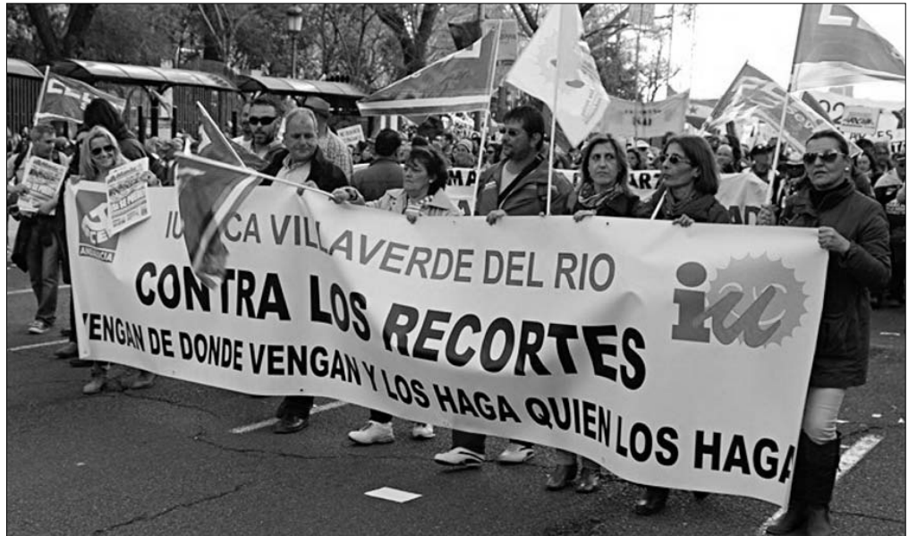
Pancarta contra los recortes de Izquierda Unida de Villaverde del Río

H ace tres años que Izquierda Unida ganó con mayoría absoluta las elecciones municipales de Villaverde del Río (Sevilla). Este logro histórico, después de que el PSOE y el PP pactaran un acuerdo de